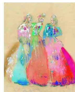
NAVARREDONDA, 16, 17, Y 18 MARZO SAN JOSÉ 2018

El sabor agrídulce fue para los devotos de los patrones de la aldea que no pudieron verlos procesionar por sus calles, debido al mal tiempo, aunque si lo acompañaron en la iglesia de Navarredonda, donde también se realizó la ya tradicional "zumbá" y la misa en honor a sus patrones.