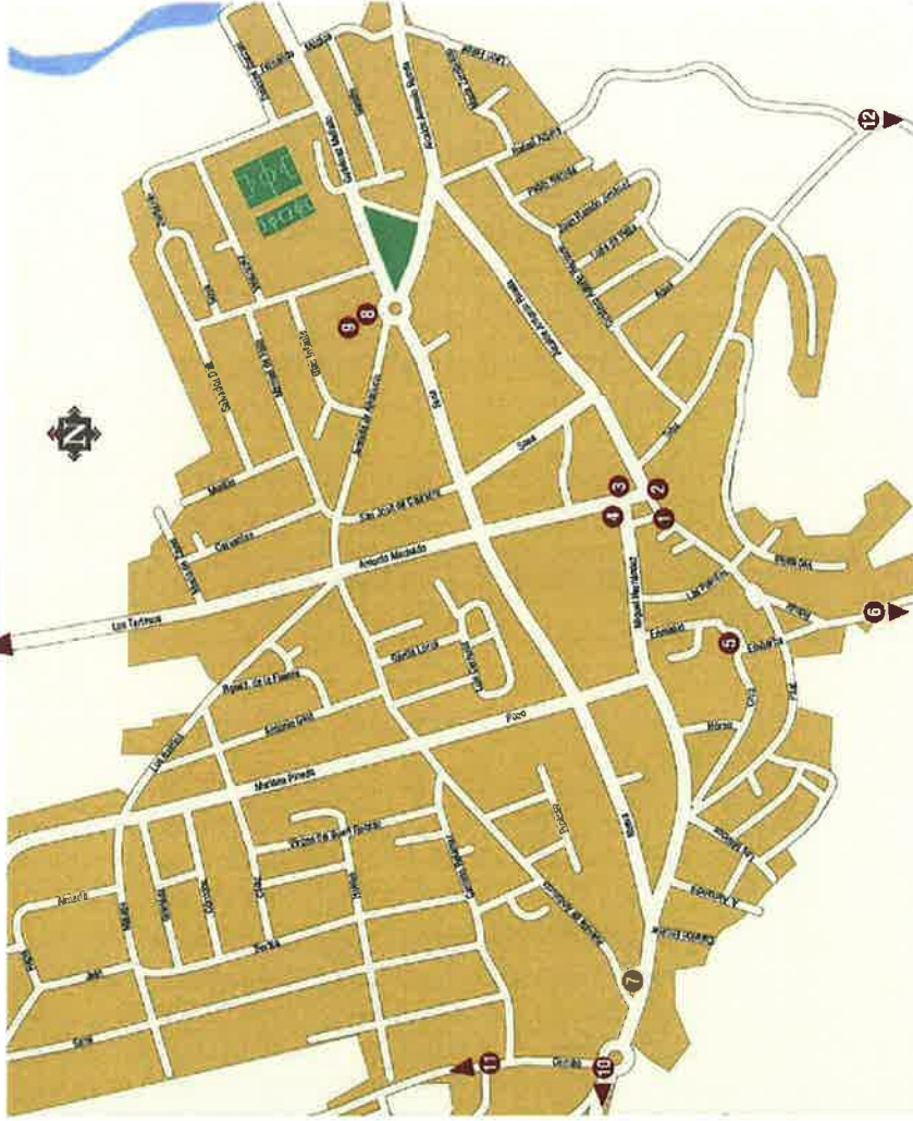
Es una realización de la Oficina de Turismo / Cartografía Enrique Mesa